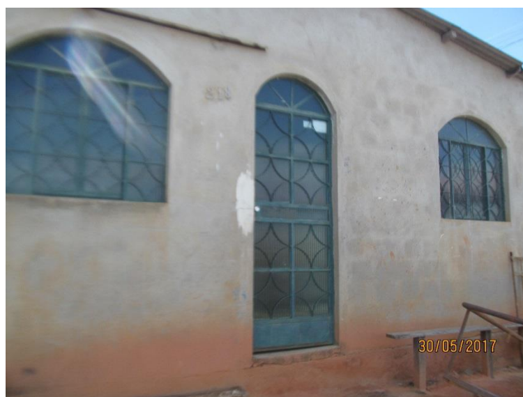
Figura 1. Registro fotográfico da visita.

No dia 10/06/2017, equipe técnica da empresa Synergia, enviou SMS para os números declarados pelo manifestante, com o objetivo que a família entre em contato com a empresa para realização do Cadastro Integrado.